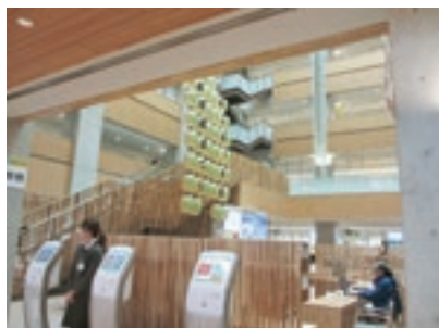
秋田市役所ロビー