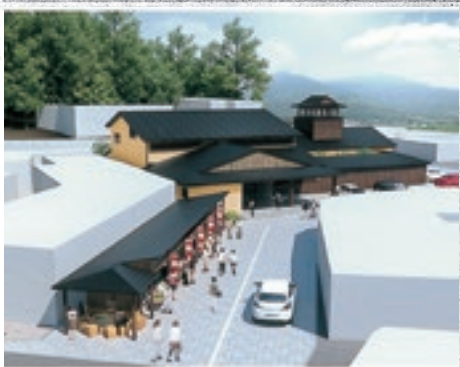
新しい温泉会館のイメージ図