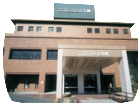
公設「ニコニコこども館」