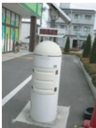
施設前の放射能測定器