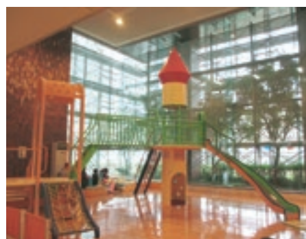
公設「ニコニコこども館」 屋内遊具施設