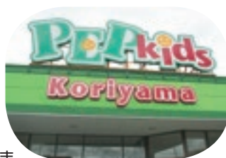
ペップキッズこおりやま