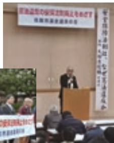
H28年2月9日 勉強会開催