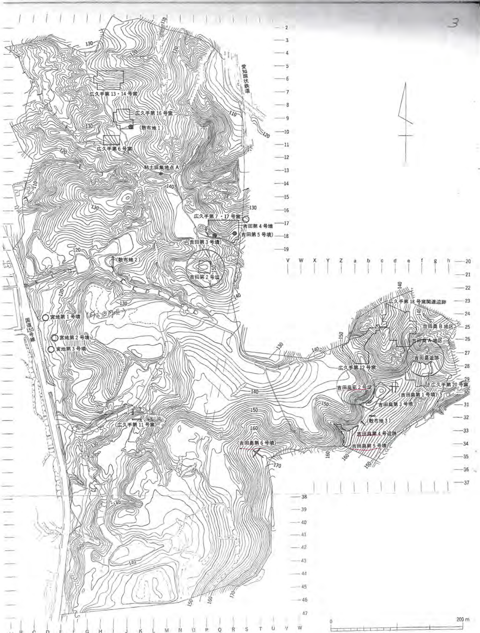
図1 上之山遺跡全体図 (縮尺1/2,500)